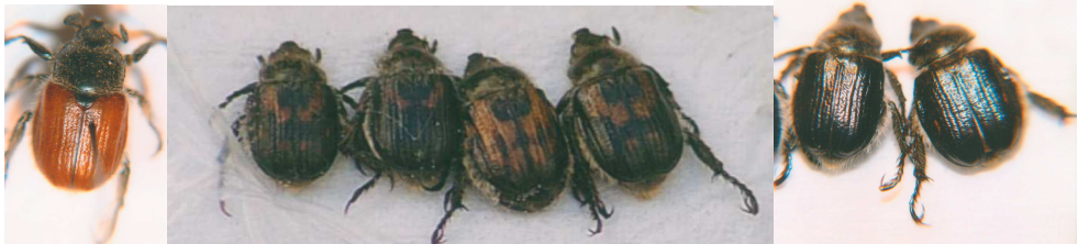
Fig. 3. Distintas formas cromáticas de Anisoplia remota Reitter, 1889.

Como otras especies del género, Anisoplia remota tiene varias formas cromáticas, y en los individuos menorquines, aparte del color corporal negro, en los élitros presenta varios tipos de coloración, desde la forma típica pardo amarillenta (alrededor del 65% de los ejemplares capturados), a los élitros negros, de intensidad a veces algo reducida, probablemente en ejemplares juveniles, (el 10 % del total), que constituye la ab. funerea Muls., y la también negra con una gran mancha arqueada amarilla, común, en