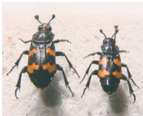
Fig. 1. Nicrophorus interruptus Stephens, 1830.

Aunque la especie cuenta con numerosas variedades cromáticas (Portevin, 1926; Báguena, 1965), los ejemplares menorquines que he visto (Compte), son re-